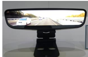
AUO 8.9型フリーフォーム ミラー