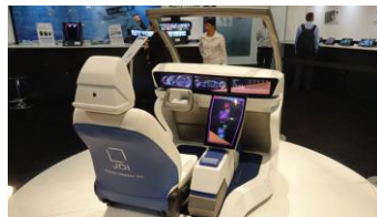
JDIのコンセプトコックピット